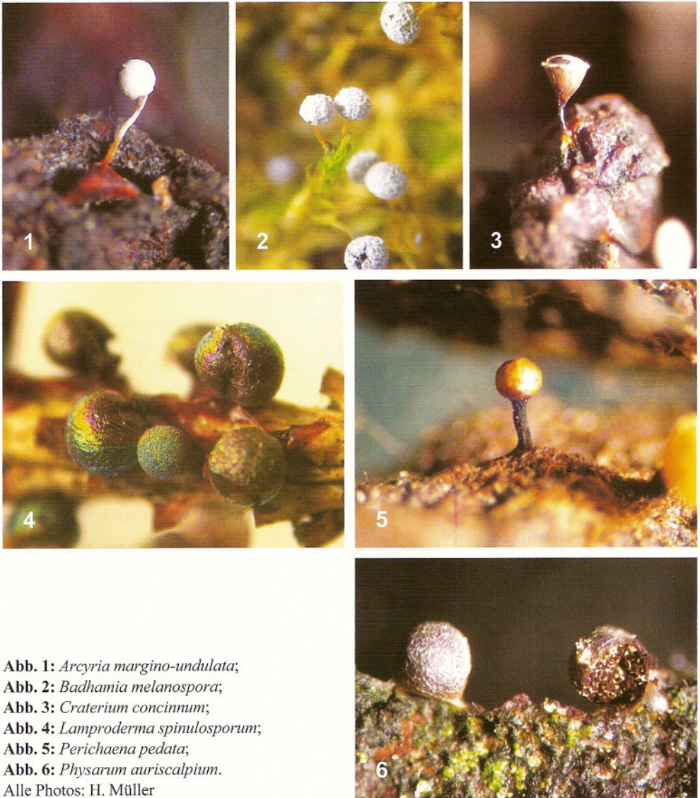
Abb. 1: Arcyria margino-undulata ; Abb. 2: Badhamia melanospora ; Abb. 3: Craterium concinnum ; Abb. 4: Lamproderma spinulosporum ; Abb. 5: Perichaena pedata ; Abb. 6: Physarum auriscalpium .