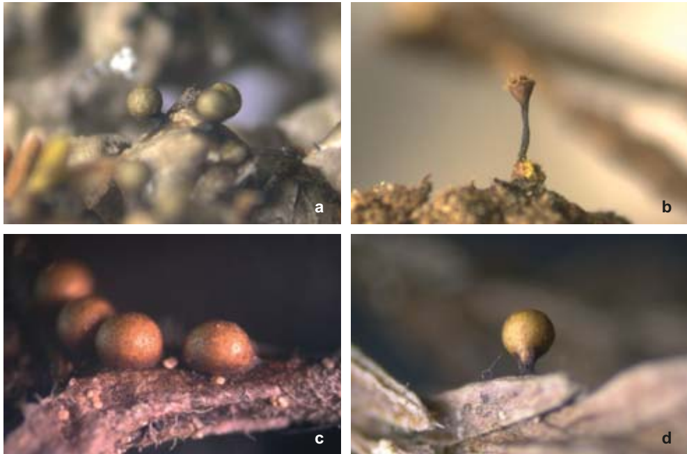
Abb. 2: Sporocarprien von a. Hemitrichia leiotricha ; b. Trichia munda ; c. Trichia cf. contorta var. attenuata ; d. Trichia sp.