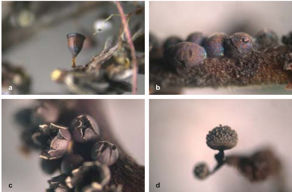
Abb. 3: Sporocarprien von a. Craterium minutum var. brunneum ; b. Physarum cf.; c. Diderma asteroides ; d. Physarum squamosum